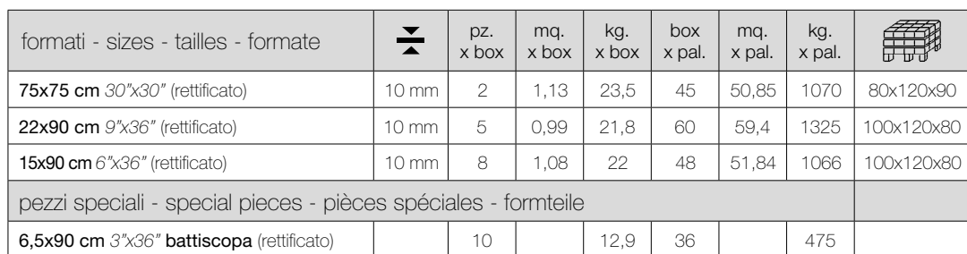
Tabella pesi ed imballi - Sizes weight and packaging Mesures poids et emballages - Tabelle der Gewichte und Verpackungen